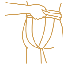
入浴用介助ベルト

「入浴用介助ベルト」とは、身体に直接巻き付けて使用するもので、浴槽への出入り等を容易に介助することができます。