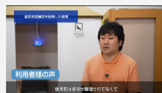
障害者が安心して仕事に集中できる「calm down 室」の設置