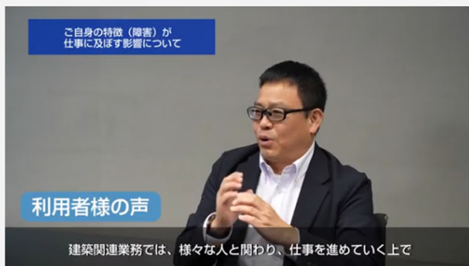
VUEVO（ビューボ）によるインクルーシブコミュニケーションの実証