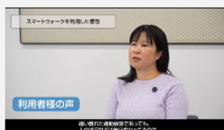
白杖歩行支援機器スマートウォークのモニター評価