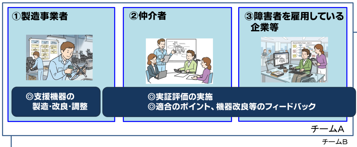
図：応募に係る評価チームの体制