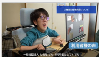
重度肢体不自由を有する方の能力の発揮に向けた機器の導入による就労…