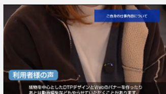
「生成AIとスマートグラスを活用した障がい者の就労支援機器」の…

また、本事業は「支援機器等導入実証事業（事業名：自立支援機器を活用する就労支援プロジェクト）」の一環で行ったものです。