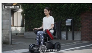
倉庫環境におけるモビリティ支援機器導入の効果に関する評価