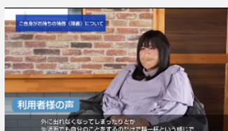
身体感覚に作用する支援機器の活用による知的・精神障害者の就労支援…