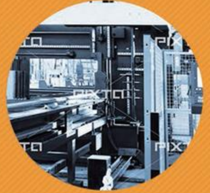
国内製造 (Made in Japan)